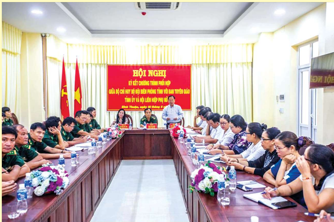
Hội nghị ký kết Chương trình phối hợp công tác giữa Bộ Chỉ huy Bộ đội Biên phòng tỉnh với Ban Tuyên giáo Tỉnh ủy và Hội Liên hiệp Phụ nữ tỉnh.