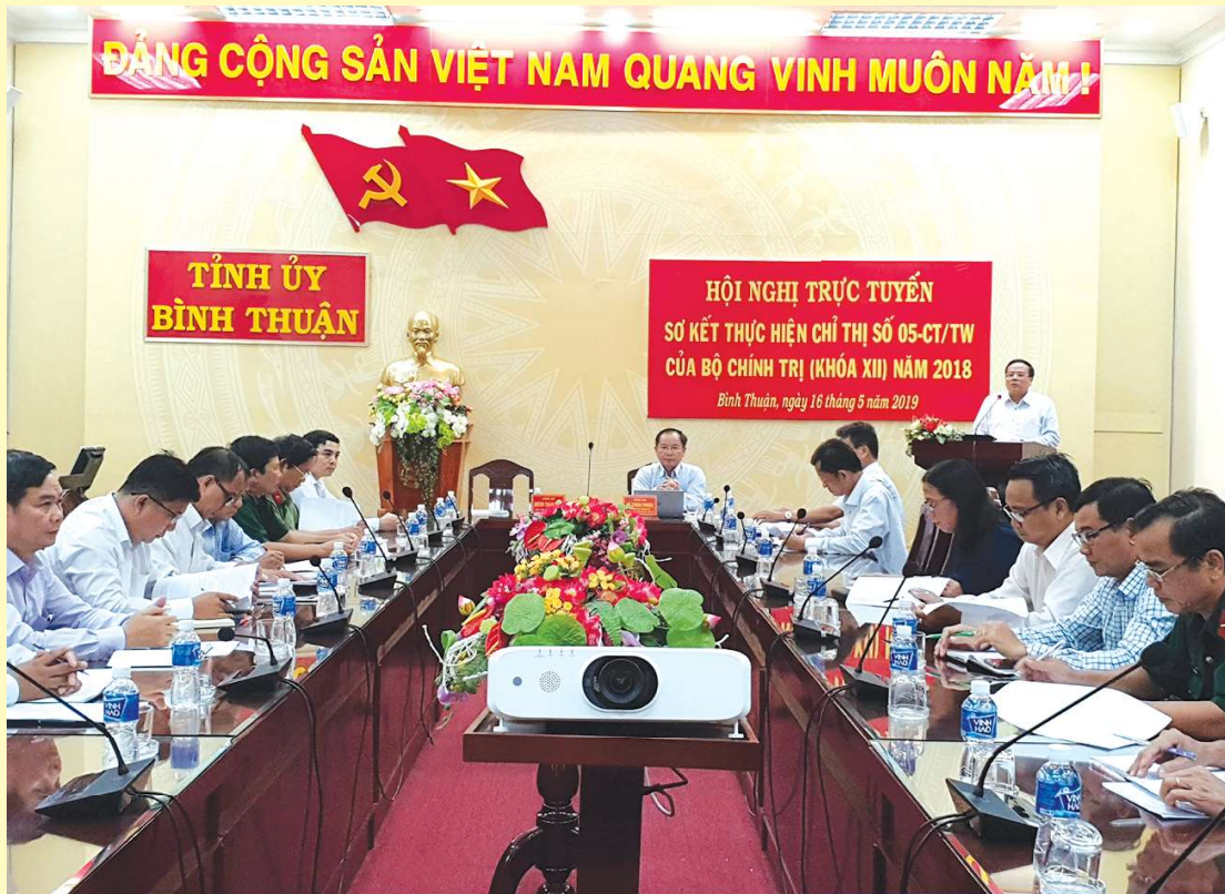
Hội nghị trực tuyến sơ kết thực hiện Chỉ thị số 05-CT/TW của Bộ Chính trị (khóa XII) năm 2018.